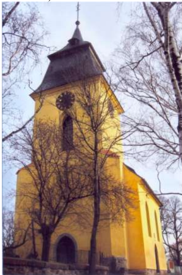
Kostel apoštolů Jana a Pavla, Malín