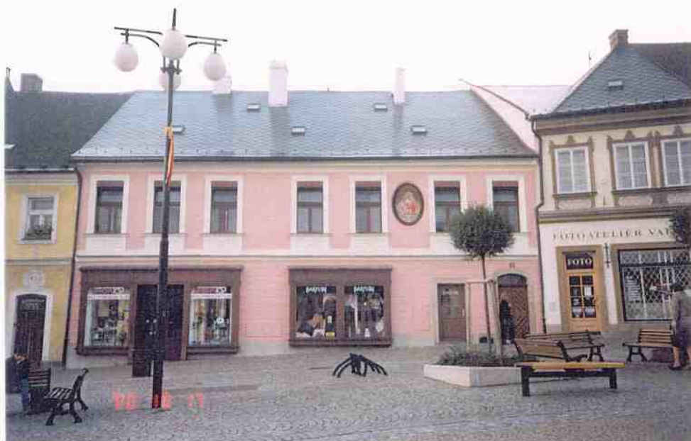
Čp. 93 Palackého náměstí v Kutné Hoře obnova fasád provedena v roce 2000