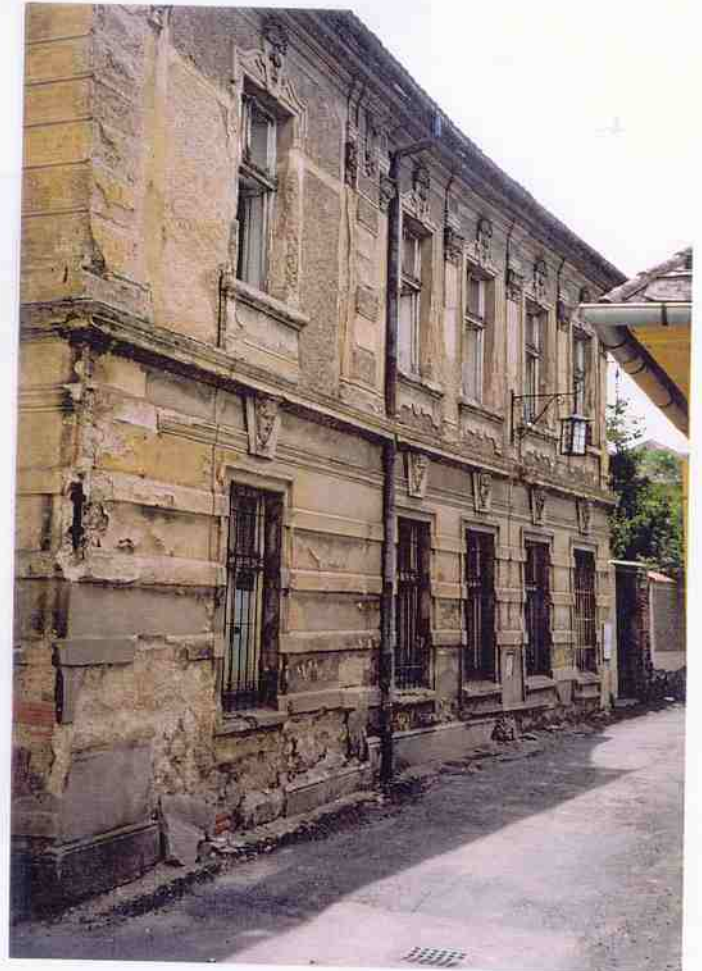
Čp. 303 Poděbradova ulice v Kutné Hoře stav objektu před celkovou obnovou