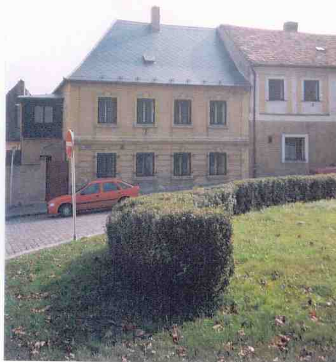
Čp. 545 Havlíčkovo náměstí obnova střechy 2000