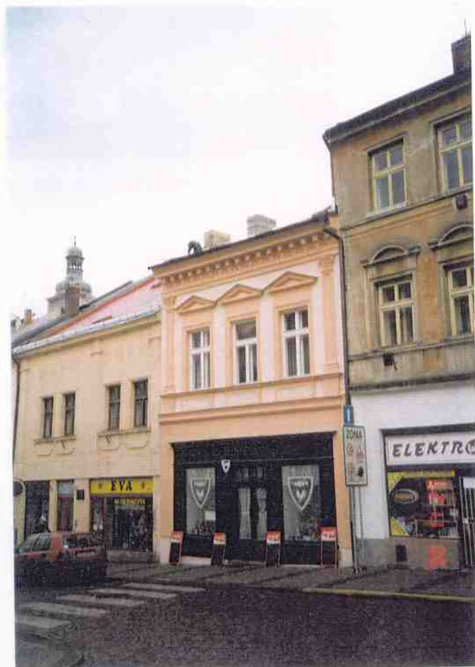
Čp. 115 Husova ulice v Kutné Hoře obnova fasád provedena v roce 2000