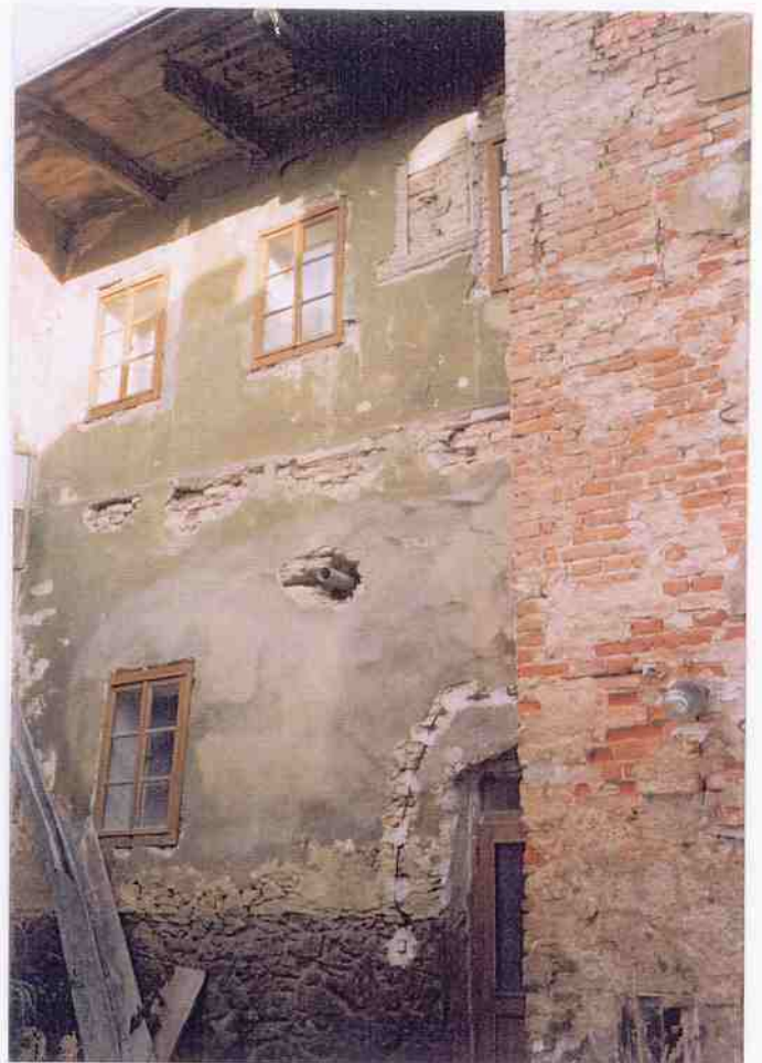
Čp. 487 ulice U Jelena obnova fasád stav před obnovou