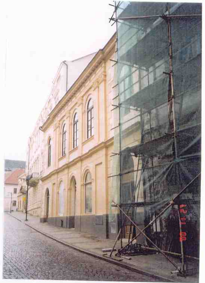
Čp. 151 Husova ulice v Kutné Hoře obnova fasád provedena v roce 2000