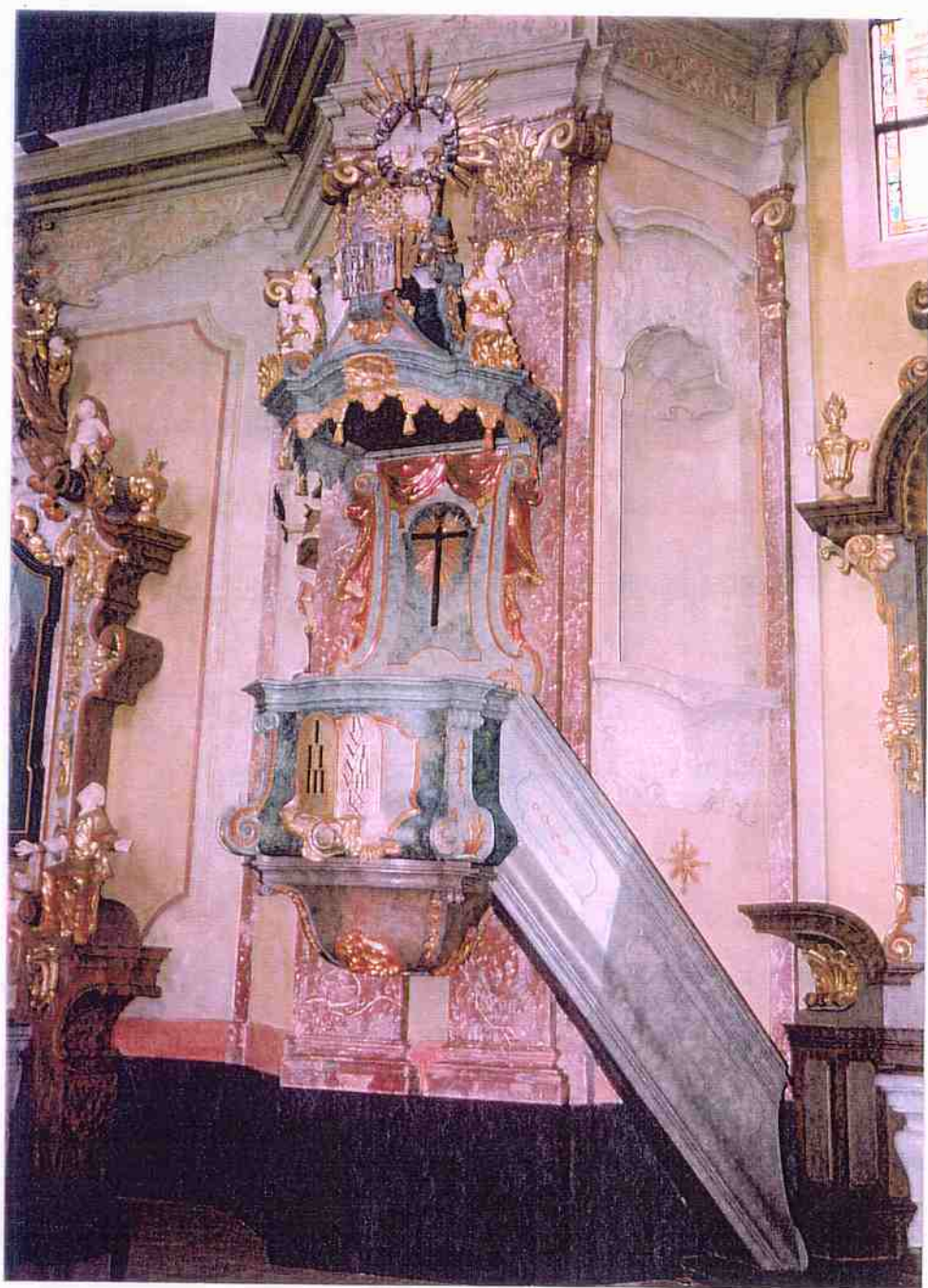
Kostel sv. Jana Nepomuckého v Kutné Hoře dokončená obnova interiéru