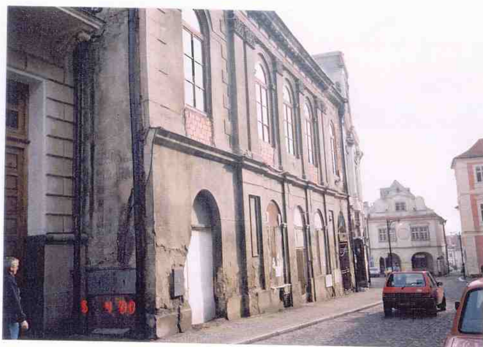
Čp. 151 Husova ulice v Kutné Hoře stav fasád před obnovou