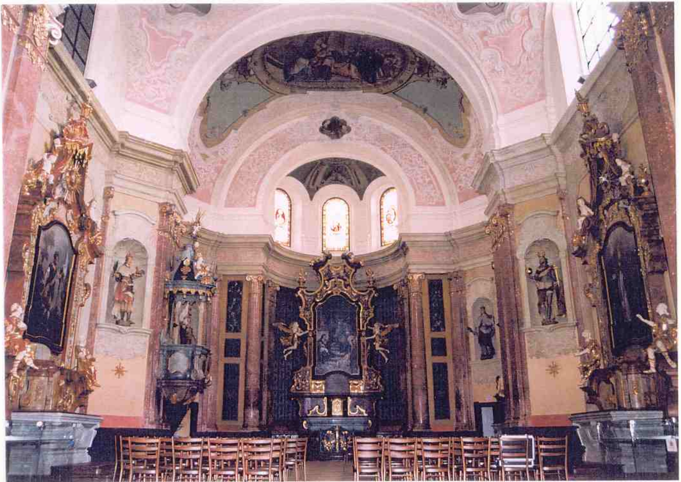
Pohled do interiéru od vstupu k hlavnímu oltáři