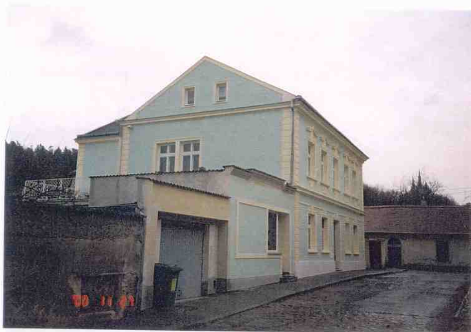
Čp. 618 Žižkova brána v Kutné Hoře obnova fasád provedena v roce 2000