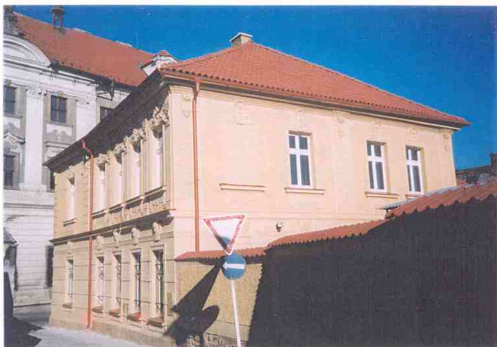
Čp. 303 Poděbradova ulice v Kutné Hoře celková obnova domu provedena v roce 2000