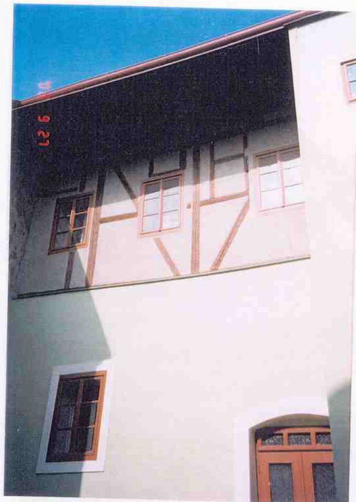
Čp. 487 ulice U Jelena obnova fasád provedení obnovy v roce 2000