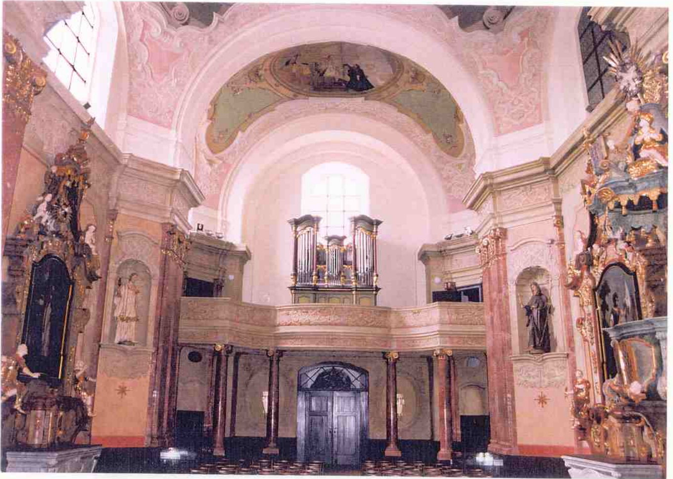
Pohled do interiéru od hlavního oltáře ke vstupní části