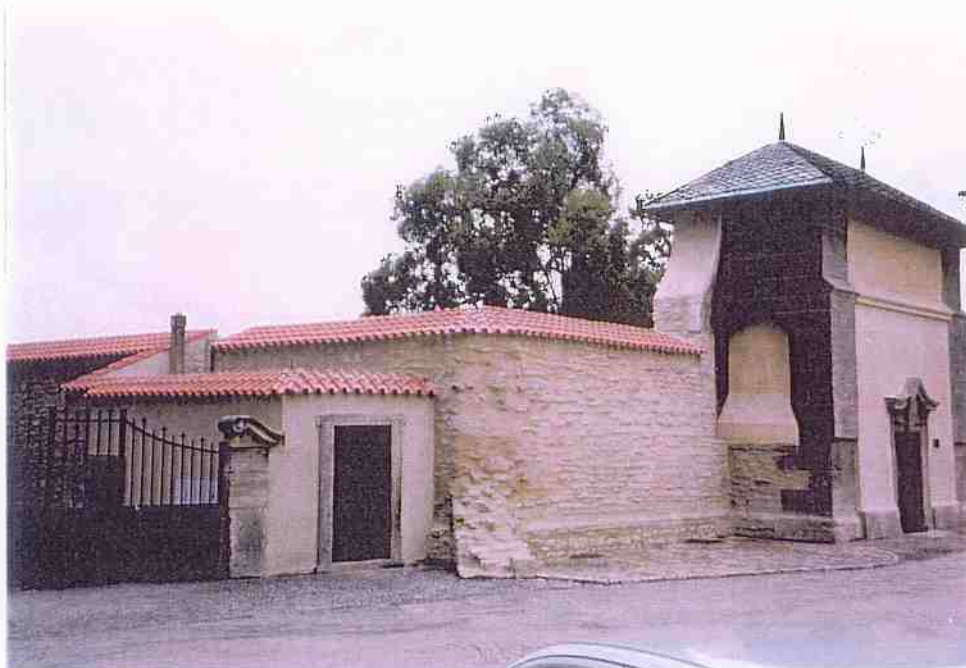
Kaple Božího těla v Kutné Hoře dokončená obnova