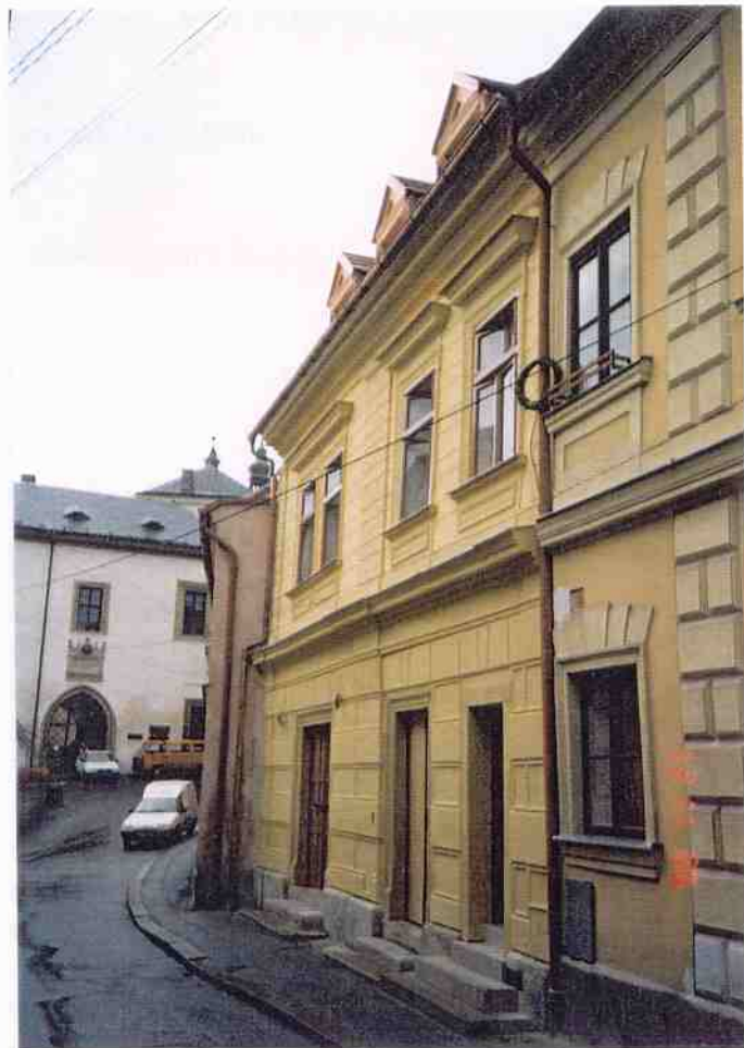
Čp. 36 Barborská ulice v Kutné Hoře obnova fasád provedena v roce 2000