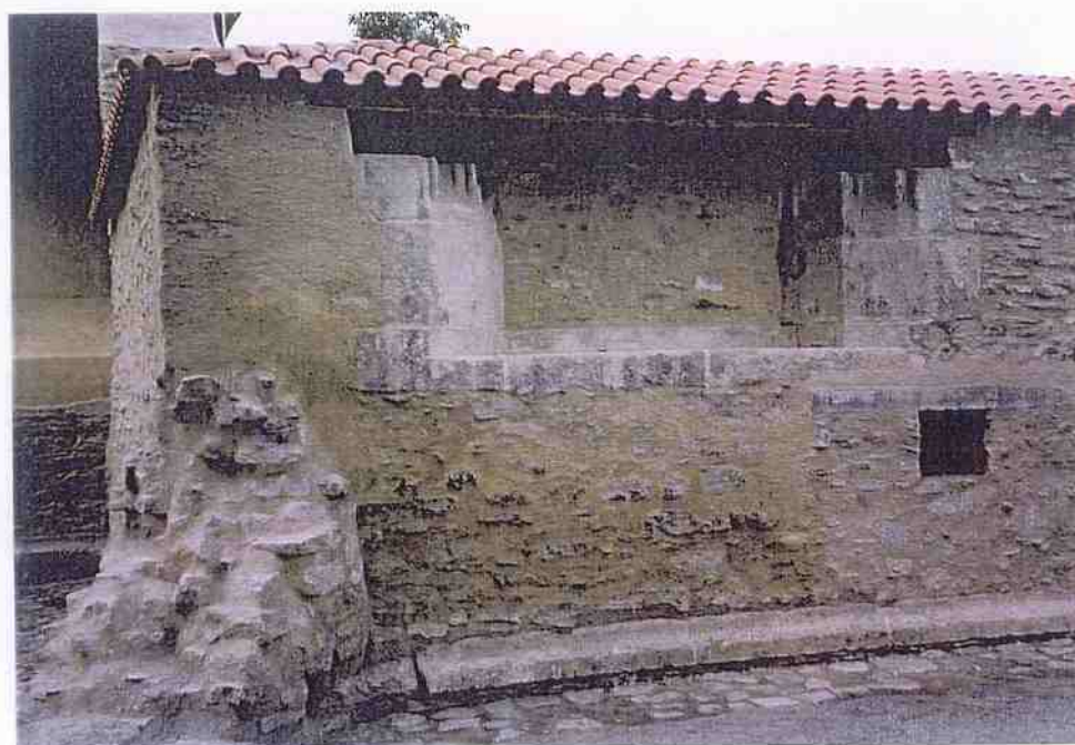
Kaple Božího těla v Kutné Hoře dokončená obnova