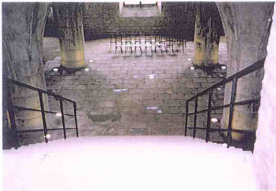
Kaple Božího těla v Kutné Hoře dokončená obnova